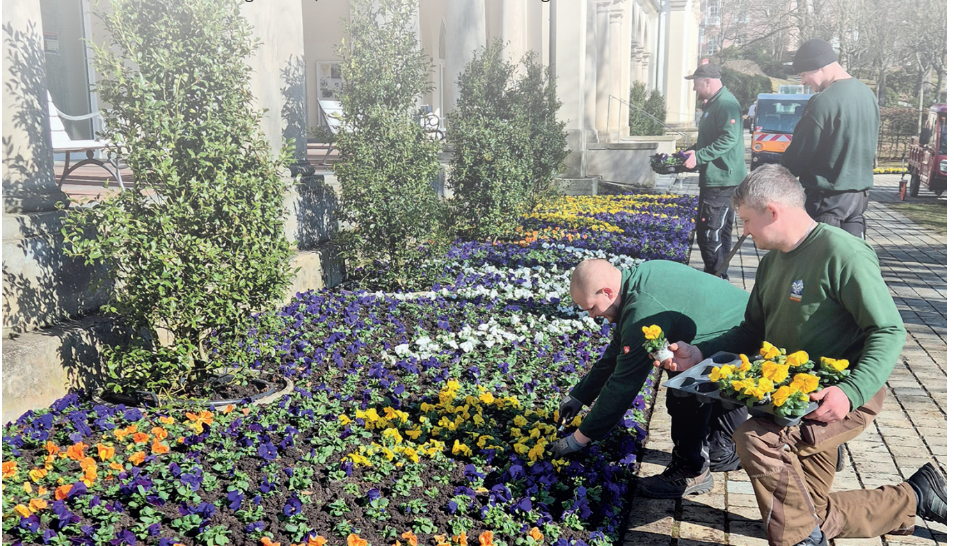
Behutsam werden die Viole aus den kleinen Pflanztöpfchen genommen, bevor sie in die frisch aufgetragene Blumenerde eingebracht werden.

Gut drei Wochen dauerte es, bis die Gärtner mit der Bepflanzung des Kurparks fertig waren – allein für die Arbeiten vor der Wandelhalle benötigt man zwei bis drei Tage. Doch damit nicht genug, gilt es doch, bereits Ende Mai mit der Sommerbepflanzung zu beginnen. Ein dritter Wechsel in den Beeten erfolgt im Herbst. Dann werden auch die Blumenzwiebeln gesteckt, die nun im Frühling in vornehmlich hellen Farben erstrahlen. MF