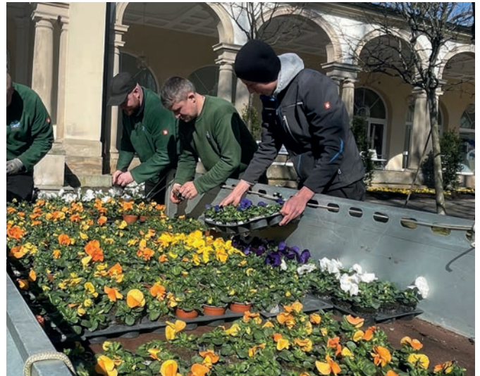
Das junge engagierte Team der Kurgärtnerei setzte auch in diesem Jahr mit neuen Pflanzarrangements wunderschöne Farbakzente.

In den anderen Beeten und Rabatten entlang der Gehwege wurden auch Goldlack, Vergissmeinnicht, Alyssum (Steinkraut) und Gänseblümchen aus eigener Anzucht behutsam in die frische Blumenerde eingebracht, die zum Teil aus