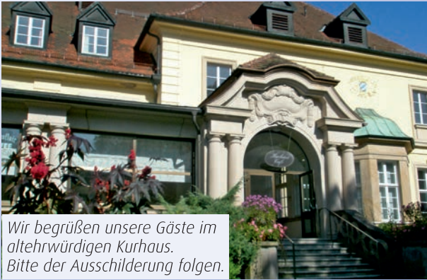
Wir begrüßen unsere Gäste im altehrwürdigen Kurhaus. Bitte der Ausschilderung folgen.

Am Donnerstag, 16. April 2026, um 19.00 Uhr im Großen Kurhaussaal in Bad Steben: