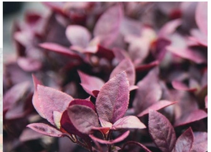
Das hitzeverträgliche „Papageienblatt“ der Sorte „Little Romance“