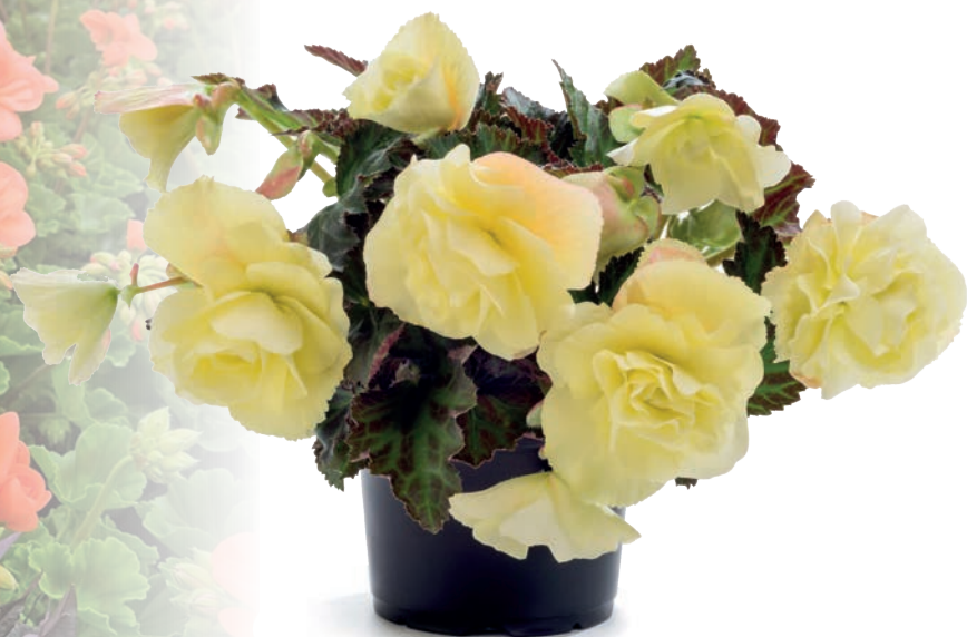
Ebenfalls neu – Begonien der Sorte „Fragrant Falls Lemon“