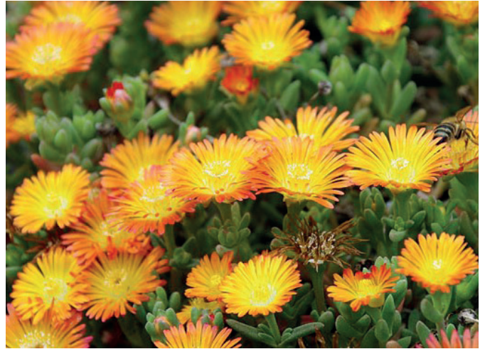
Mittagsblume „ Delosperma sutherlandii “ aus der Serie „Wheels of Wonder“

Erstmalig im Sortiment sind auch die Begonien der Sorten „Fragrant Falls Lemon“ und „Peach“, die beide herrlich nach frischer Zitrone duften und sehr kompakt im Wuchs sind. Eine weitere Neuheit ist die „ Alternanthera reineckii “ mit dem Sortennamen „Little Romance“. Das Verkaufsteam verrät: „Das sogenannte ‚Papageien-Blatt‘ besticht durch seine wunderschön violett-farbigen Blätter und ist ebenfalls sehr gedungen im Wuchs und gut hitzeverträglich.“