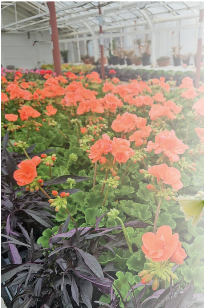
Volle Tische. Riesige Auswahl – in den Gewächshäusern der Kurgärtnerei