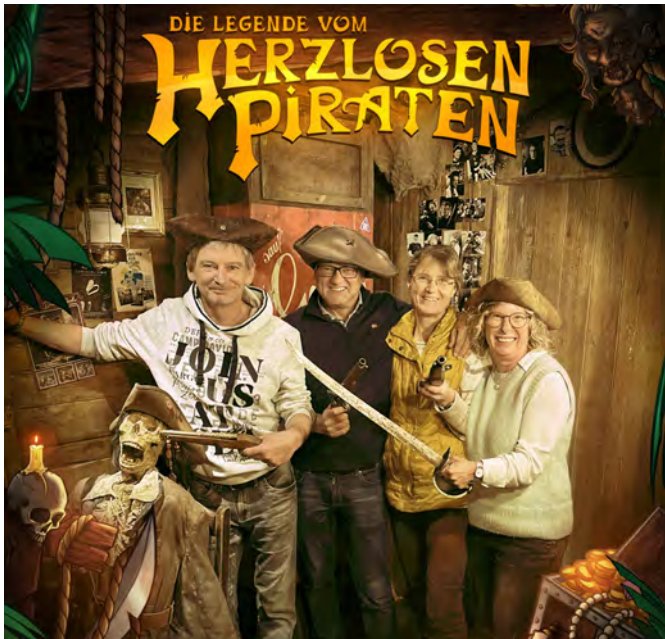
Waren hellauf begeistert vom Eintauchen in die Welt des „Herzlosen Piraten“: die Testspieler von Therme und Spielbank Bad Steben.

Bereits kurz nach Eröffnung im vergangenen Herbst wurde Bad Stebens „Traum-Labor“ (Dream-Labs) von der Internet-Plattform EscapeRoomers.de zum besten Escape-Room in Bayern gekürt – vom Blog „Escape Maniacs“ sogar zum besten Spiel Deutschlands. Mit zehn von zehn Punkten erhielt „Die Legende vom Herzlosen Piraten“ die höchstmögliche Bewertung in Europa. Auch die „Kur- & Wellness“-Redaktion ließ sich jetzt auf