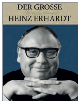
© Aus: „Das große Heinz Erhardt“-Buch, 2009 Lappan Verlag, Oldenburg

Dieser Leseabend präsentiert das Beste aus seinen Büchern – aber auch viele unbekannt kleine Meisterwerke, bei denen man sich freut, sie entdeckt zu haben. Es darf gelacht werden!!!